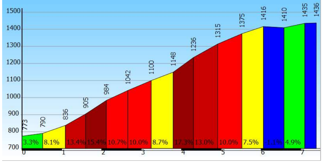
Colletto Pian dei Muli