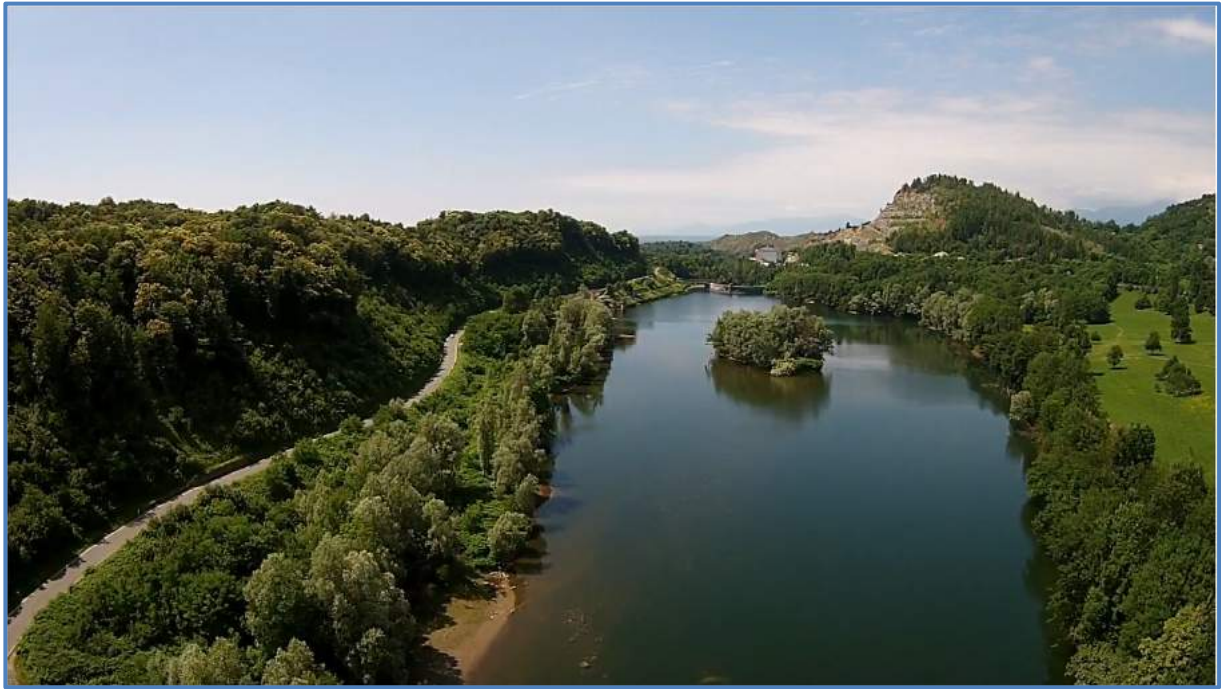
Val Chuisella – Lac Vidracco ou de Vistrorio – Barrage de Gurzia au loin