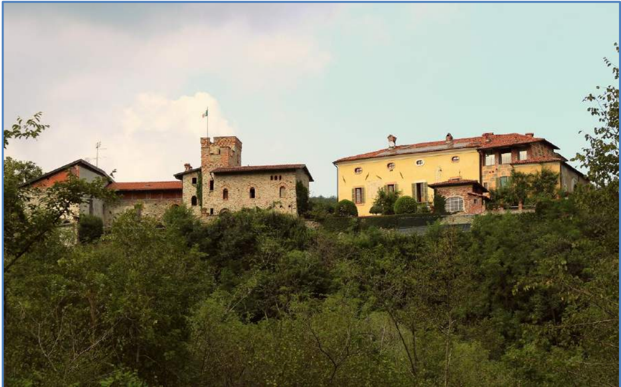
Château de Strambinello

On remonte la Via Guglielmo Jervis jusqu'au rond-point. On prend la quatrième sortie pour la SP68 qui passe devant un grand parking près de la caserne des pompiers. A hauteur du point [V2] prendre le chemin à gauche barré par un portail ouvert. Continuer jusqu'au point [V3] et prendre la piste R1 à droite. Le Passo delle Banche (281m) est dans une clairière. Continuer le chemin à gauche qui descend vers Bellavista. Au point [V4] prendre la piste à droite qui rejoint la Via Europa [V5] . Poursuivre jusqu'à la Via Enrico Fermi [V6] à gauche puis à [V7] prendre la Via Cantone Carasso et à [V8] prendre la Via Torino à droite. On rejoint la SS26 au point [V9] et 500 plus loin prendre la SP82 à droite en direction de Romano Canavese et Scarmagno. La SP82 mène tout droit au Passo di Santa Croce (359m). Au col on quitte la SP82 pour prendre à droite la Strada di Cuceglio qui passe au-dessus de l' A5 . Au carrefour avec la SP54 prendre tout droit la SP54DIR2 en direction de Vialfre. [V11] . A Vialfre traverser le bourg par la SP55 et aller en direction de San Martino Canavese. Au point [V12] traverser le bourg par la Via Arduino. En sortant du bourg descendre vers Pranzalito par la SP63Dir1 puis Collettero Giacoso. [V16] Tourner à gauche en direction de Parella. A [V18] prendre à gauche la SP222 en direction de Zucca Qualiuzzo. Au point [V19] prendre à droite la Via Scala jusqu'à [V20] on rejoint la Via Stradale Valchuisella. On arrive à Strambinello.